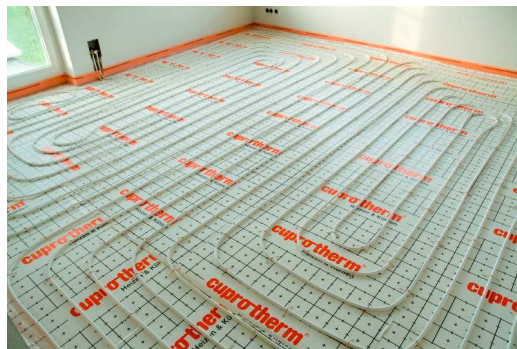
cuprotherm: Das klassische Flächen temperierungssystem mit dem flexiblen Kupferrohr CTX